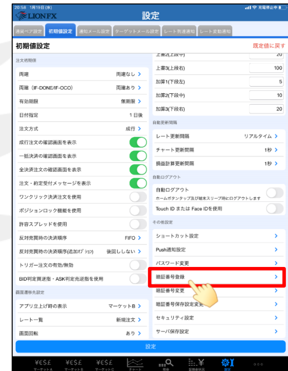
③ 【暗証番号登録】をタップします。