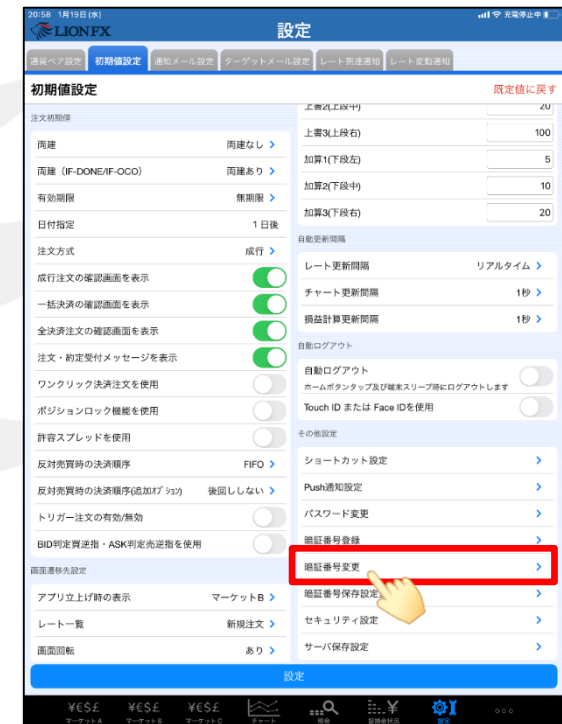
③ 【暗証番号変更】をタップします。