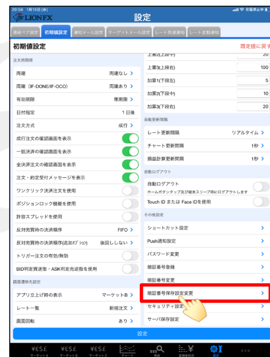
③ 【暗証番号保存設定変更】をタップします。